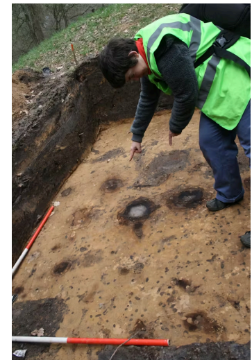
Liesbeth Theunissen wijst in een werkput de sporen aan (bruin met grijze binnenkern) van twee palen uit de bronstijd.

Ook de bronstijdsporen die de duizenden jaren oude palen hadden achtergelaten werden niet uitgegraven. Zo blijven ze, veilig in de bodem, beschikbaar voor volgende generaties wetenschappers. Want naarmate de tijd verstrijkt, borrelen steeds