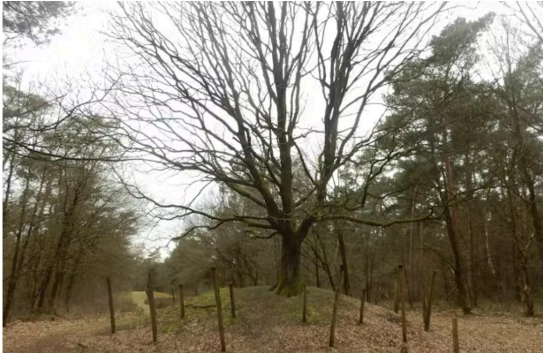
Dubbele wijdgestelde palenkrans bij Toterfout (heuvel 5)